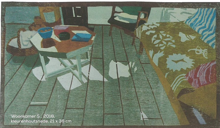
‘Woonkamer S.’, 2018, kleurenhoutsnede, 21 x 36 cm

Eline Brontsema's werk is te zien op haar website: elinebrontsema.com