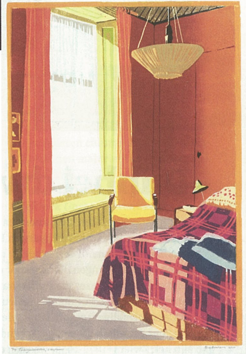
‘Euvelgunnerheem, slaapkamer’, 2020, kleurenhoutsnede, 36 x 24 cm

Printmaking Award 2019, kreeg haar kleurenhoutsnede Woonkamer S. de eerste prijs.